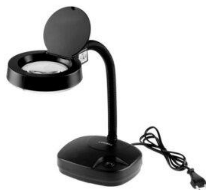
Электронный стационарный увеличитель