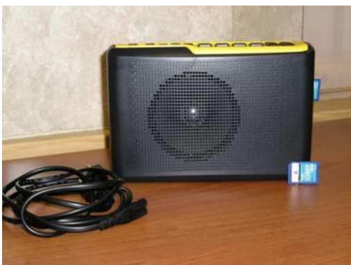
Специальное устройство для оптической коррекции слабовидения Лампа-луна

Тифлотехнические средства реабилитации для слепых и слабовидящих, имеющиеся в отделении социальной реабилитации инвалидов.